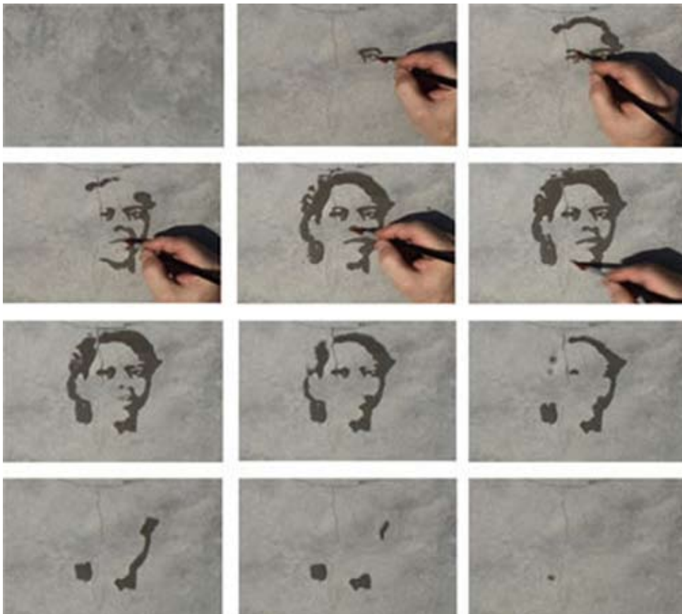
Oscar Muñoz "Project for a Memorial", 2005, 5 videoprojeksjon