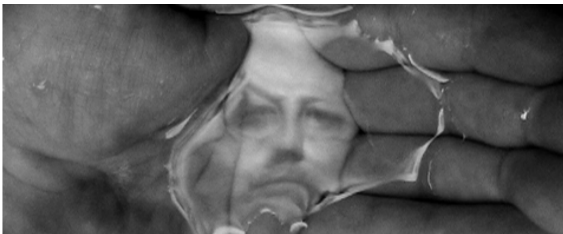
Oscar Muñoz "Linea del destino" (Line of destiny), 2006, video